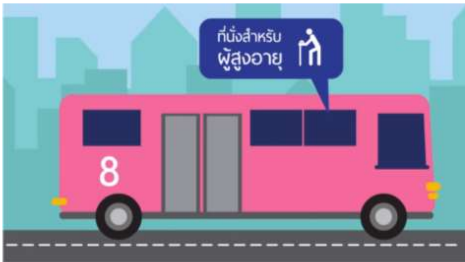
ยานพาหนะจะต้องมีที่นั่งสำหรับผู้สูงอายุ