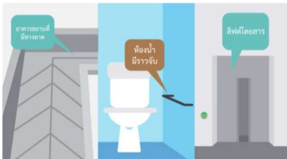
อาคารสถานที่ที่มีทางลาดชัน ห้องน้ำมีราวจับ ลิฟต์โดยสาร

ผู้สูงอายุได้รับการจัดสภาพแวดล้อมที่เหมาะสมสำหรับผู้สูงอายุ การดูแลช่วยเหลือจากเจ้าหน้าที่ การบริการที่สะดวก รวดเร็ว ปลอดภัย การจัดพาหนะอำนวยความสะดวกสำหรับผู้สูงอายุ