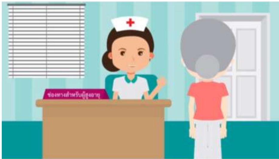
ช่องทางเฉพาะสำหรับผู้สูงอายุ

ผู้สูงอายุได้รับการจัดช่องทางพิเศษเฉพาะเพื่อให้ผู้สูงอายุได้รับการบริการที่สะดวก รวดเร็ว