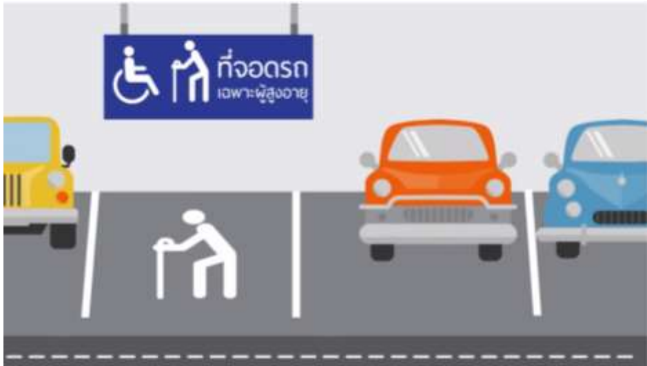
มีที่จอดรถเฉพาะผู้สูงอายุ