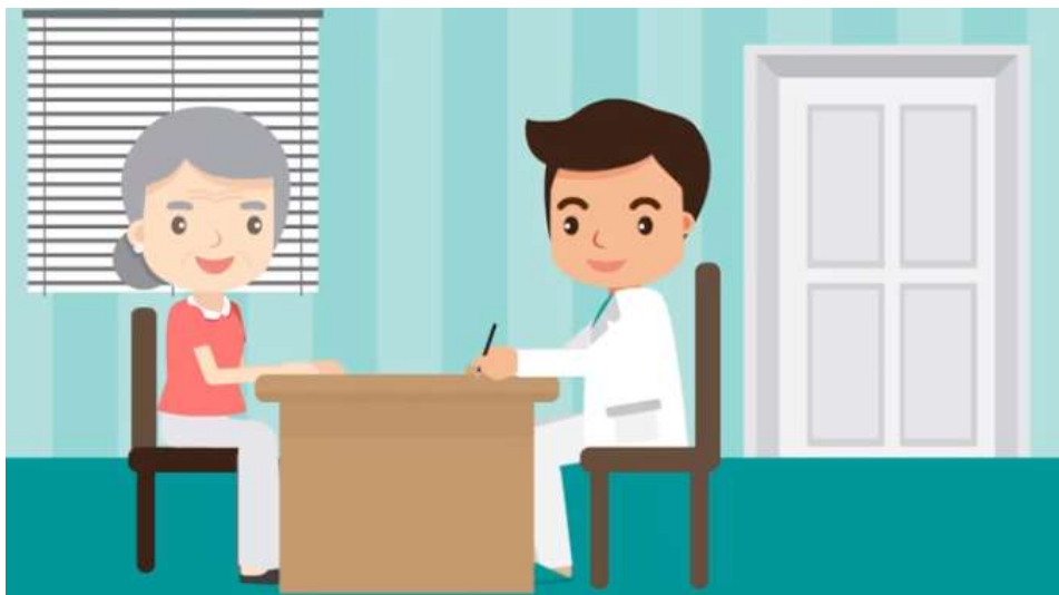
คลินิกสำหรับผู้สูงอายุ